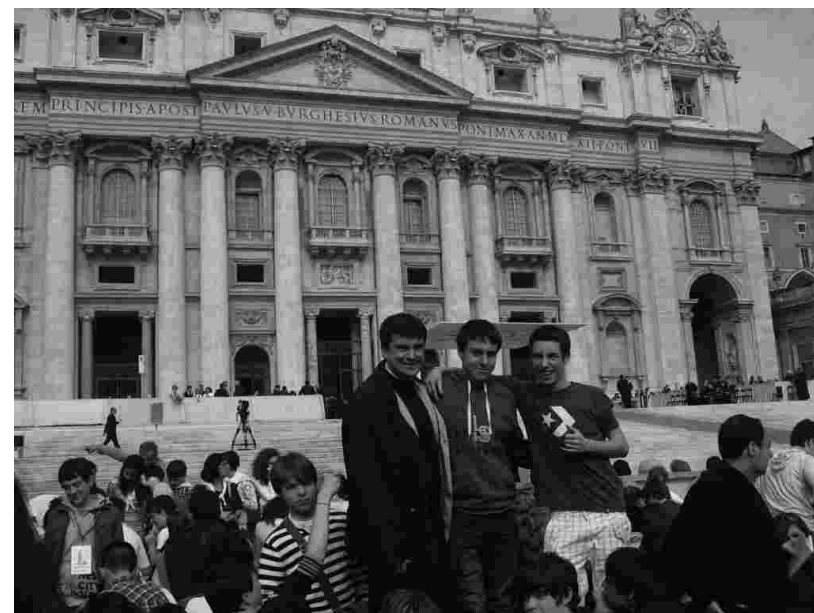
Roma, Piazza San Pietro, udienza generale del Santo Padre del 28 aprile 2011: "Io c'ero".