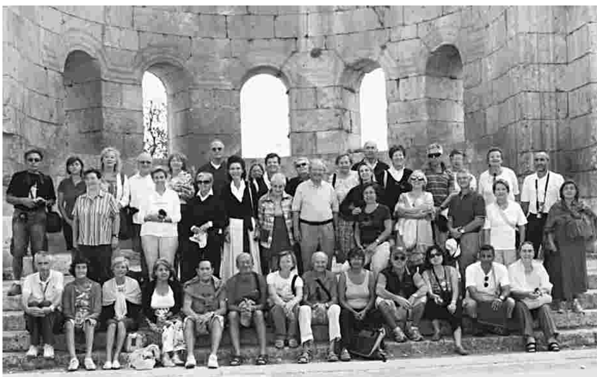
La nostra Parrocchia ha promosso e realizzato un viaggio-pellegrinaggio in Siria dal 10 al 17 settembre 2009. Abbiamo visitato la capitale, Damasco, dove si ricorda la conversione di San Paolo. Numerosi i centri monastici visitati, tra cui i resti della grandiosa basilica dedicata a San Simeone lo Stilita (nella foto, il gruppo). Tra le tappe più suggestive: Palmyra, nel deserto; e Aleppo, dove abbiamo incontrato il Delegato Apostolico mons. Giuseppe Nazzaro.