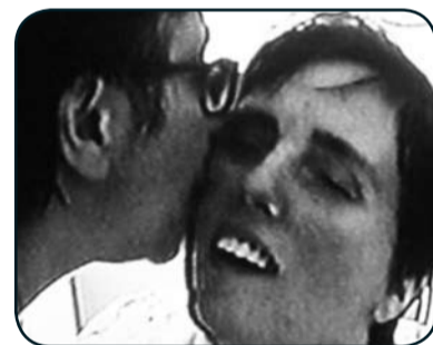
Terry Schiavo, caso emblematico di eutanasia: le fu sospesa la somministrazione dell'alimentazione e dei liquidi necessari per vivere.

da determinare la morte del paziente. Faccio un esempio: è molto chiaro ed assolutamente logico che si possa chiedere di non essere sottoposti ad accanimento terapeutico, a cure sproporzionate, gravose ed assolutamente inutili. E' giusto e credo che tutti condividano una posizione di questo tipo. Ritengo giusto e da tutti condiviso il fatto che non si possa chiedere d'essere abbandonati dal punto di vista terapeutico. Però, già il fatto di poter domandare –come si azzarda nelle proposte di legge presentate in materia, otto in tutto- d'interrompere, ad esempio, l'idratazione, l'alimentazione, la respirazione, beh, queste già sono richieste assolutamente inaccettabili, poiché in questo modo si verrebbe proprio a definire la vita come un bene disponibile, di cui ciascuno è responsabile e padrone.. C'è viceversa un'indisponibilità della vita umana, che dev'essere riconosciuta e che viene riconosciuta anche a livello costituzionale, che rientra in tutti i principi sanciti dalle leggi. Questo è il punto di riferimento, questa è la bussola per l'orientamento, che non può essere dimenticata. Dentro il testamento biologico, invece, si celano purtroppo in modo assolutamente strumentale delle prospettive eutanasiche, che non vengono definite, ma che certamente vengono accolte”. ■